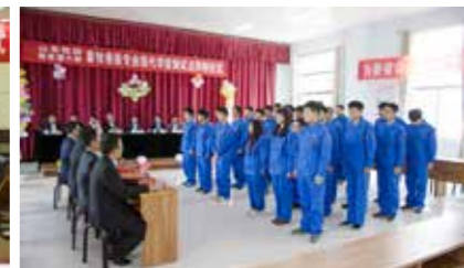
新希望六和班拜师仪式