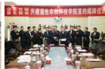
益生农牧科技学院揭牌