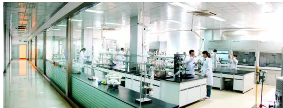
食品药品实训大厅

饲料厂、GMP 标准兽药厂、畜牧科技示范园、马术训练场等数量充足、门类齐全的校内实训基地，达到了有专业就有校内实训基地的水平。与国内外 500 多家畜牧企业建立了良好的合作关系，在业内龙头企业设立校外实训基地 290 余处。