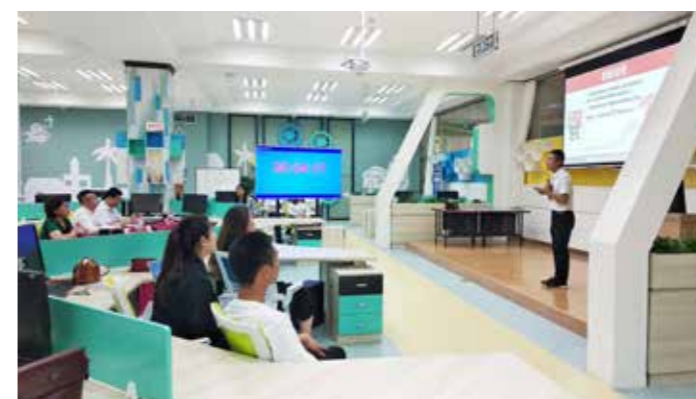
创新创业路演活动