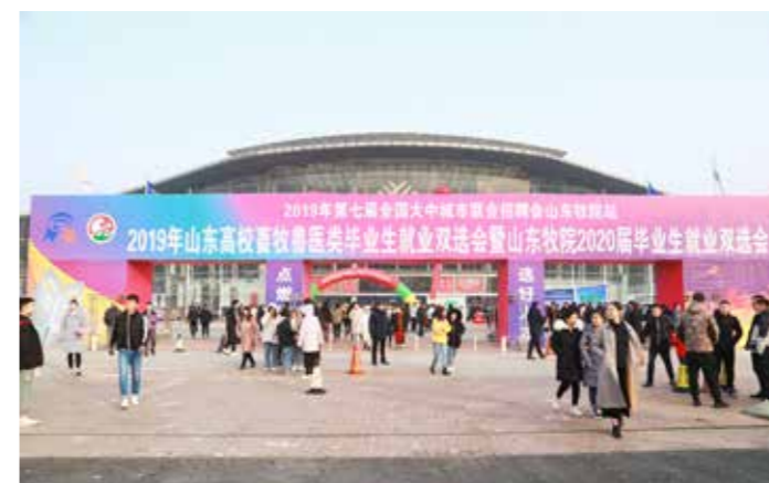
毕业生就业双选会