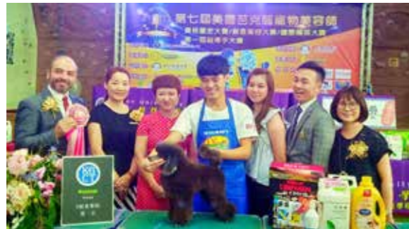
两岸合作班学生在第七届美国芭克丽宠物美容师大赛中获奖